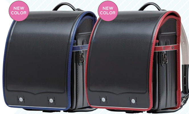
ブラック/マリンブルー