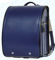
マリンブルー/ブラック