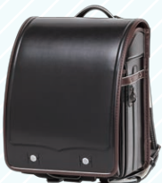
ブラック/ブラウン