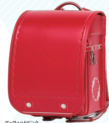
ヴィヴィッドピンク