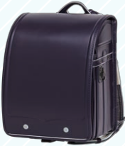
パープルネイビー